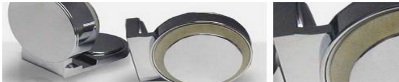
Winkel Glas/Wand 90° VarionPlus aussen (Schraubsystem)